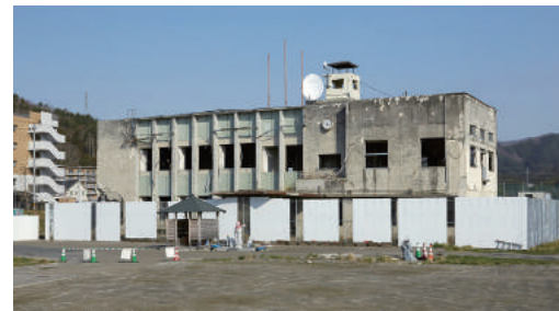
大槌町旧役場庁舎

7月28日(土) 9:00 釜石市内ホテル発→11:00頃 花巻空港着→12:00頃 盛岡駅着