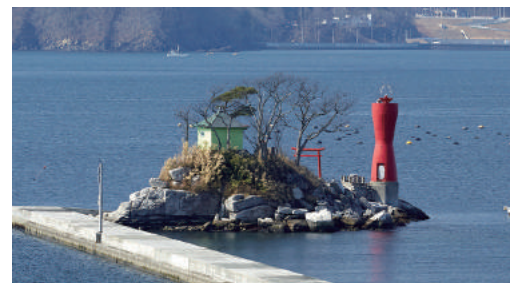
蓬萊島(ひょっこりひょうたん島モデル)